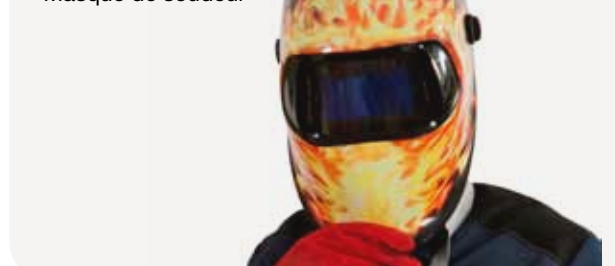
Fig. 6 Masque de soudeur

Le masque de soudeur protège le visage et le cou des rayonnements de l'arc et des projections incandescentes. Il est constitué d'un écran en matière ininflammable (fibre vulcanisée, polyester armé de fibres