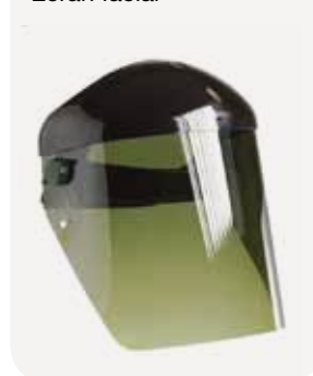
Fig. 4 Écran facial